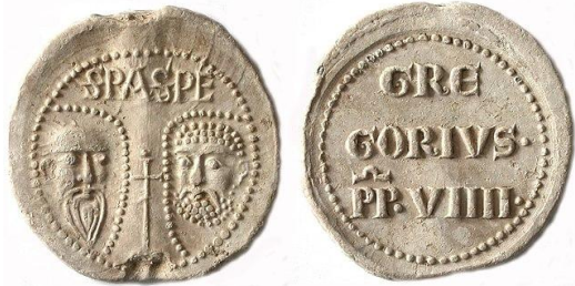
Σφραγίδα του Πάπα Γρηγορίου Θ' (1227-1241)

Κάθε Βούλα προσδιορίζεται από τις αρχικές της λέξεις. Για παράδειγμα, ο Άγιος Ιωάννης Παύλος Β΄ κήρυξε το Μεγάλο Ιωβηλαίο του Έτους 2000 με τη Βούλα «Incarnationis Mysterium» («Το Μυστήριο της Ενσαρκώσεως»), ενώ ο Πάπας Φραγκίσκος κήρυξε το Έκτακτο Ιωβηλαίο της Ευσπλαχνίας (2015-2016) με τη Βούλα «Misericordiae vultus» («Το πρόσωπο της ευσπλαχνίας»). Η Βούλα που αναγγέλλει το Ιωβηλαίο και υποδεικνύει τις ημερομηνίες έναρξης και λήξης του Αγίου Έτους, δημοσιεύεται κατά το προηγούμενο έτος, στην εορτή της Αναλήψεως του Κυρίου. Έτσι, για το Ιωβηλαίο του έτους 2025, η δημοσίευση της Παπικής Βούλας έγινε στις 9 Μαΐου 2024.